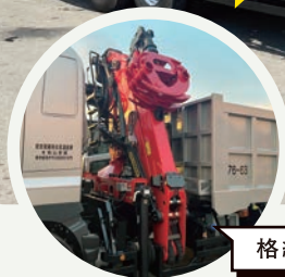
格納し走行できるナックルブームクレーン

集荷用のトラックを増車することになり、2025年9月、日野自動車製ロングボデー大型トラックに、パルフィンガー社製ナックルブームクレーンを搭載した、新しい集荷用トラックを導入しました。通称「つかみ」と呼ばれるナックルブームクレーンは、コンパクトに格納し走行できる設計でありながら、展開時は広い作業半径と高い吊上能力を持つ、解体現場などでのスクラップ回収作業には無くてはならない存在です。これからも集荷用車両の拡充とドライバーの育成を続けて、弊社の強みである「迅速な集荷対応力」を高めていきます。